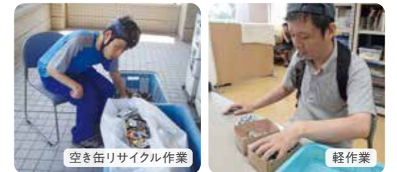
空き缶リサイクル作業

午後は自立活動やグループ活動です。創作や音楽、身の回りのことを練習したり、運動をしたりと個々のニーズに合わせた活動にも取り組んでいます。また、年間を通して、季節ごとの行事や家族参加型イベントなども開催しています。