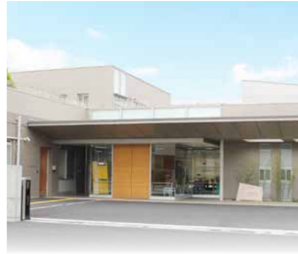
建築面積 1,811.83 平方メートル 延床面積 2,725.78 平方メートル 構造規模 鉄筋コンクリート造 2 階建

平成23年度より障害者自立支援法の就労継続支援B型、生活介護へと事業移行し、平成24年度より特定相談支援事業を開始、令和3年度より現在の事業形態に至っています。