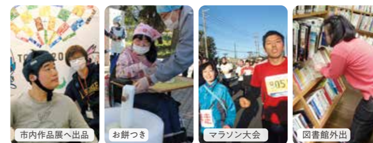
市内作品展へ出品