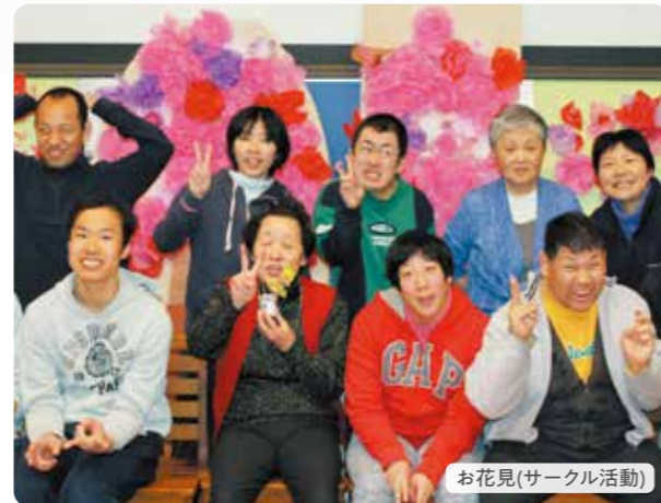
お花見(サークル活動)

日々の作業以外にも「日帰り旅行」、「忘年会(新年会)」、ご利用者と支援員が協力しながら企画実行するサークル活動での「お花見」など、皆で楽しむイベントもあり、メリハリのある生活となっています。